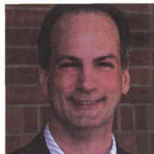
Michel Fournier Construction