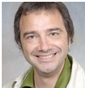
Alain Blanchette Agroalimentaire