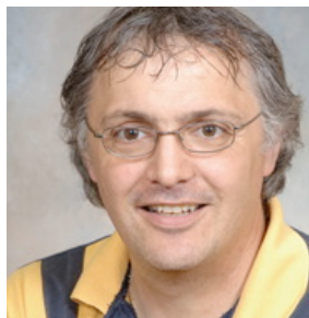
Serge Trudel Papier et Carton