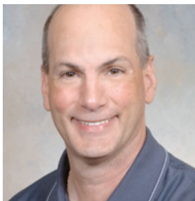
Michel Fournier Construction