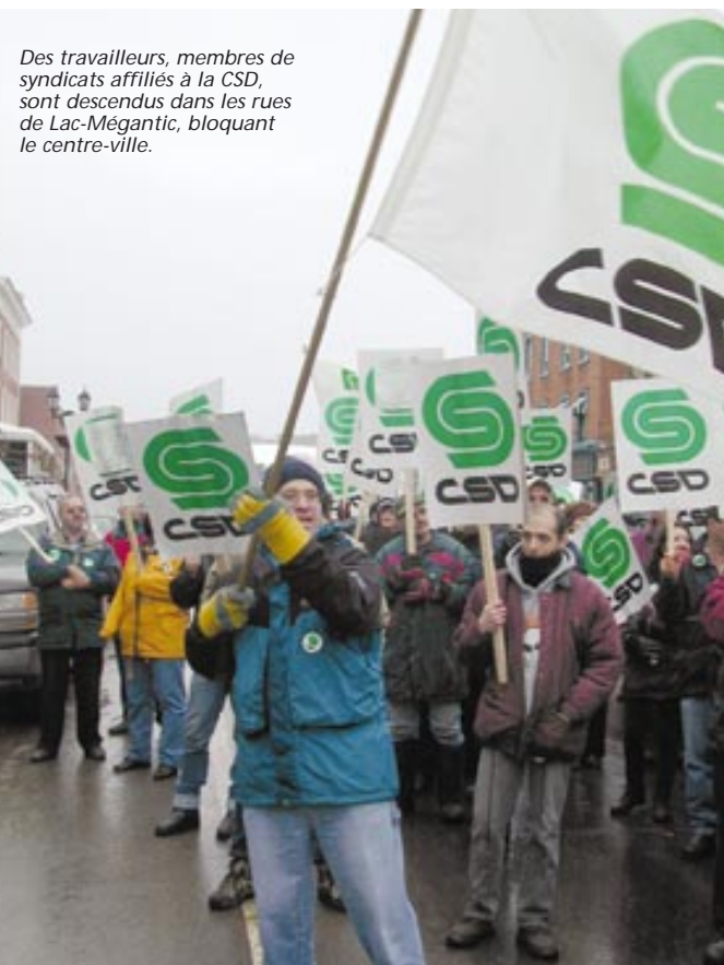
Des travailleurs, membres de syndicats affiliés à la CSD, sont descendus dans les rues de Lac-Mégantic, bloquant le centre-ville.